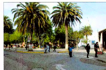
Vista de plaza e Iglesia Nuestra Señora del Rosario