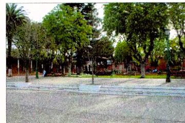
Plaza de Curepto