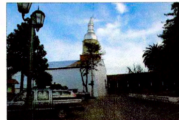
Vista de Iglesia y corredor de Casa Parroquial